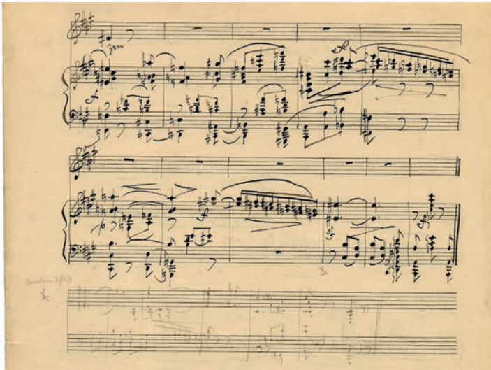
Abbildung 3: Dritter Schluss von Sehnsucht im Partitur-Auszug 59

Aus der Particellerstniederschrift 60 entstand in einem nächsten Schritt, bei dem Schönberg wiederum mit wenigen Korrekturen auskam, die erste Partiturreinschrift, d. h. in diesem Fall die Orchesterfassung. 61 Aus diesem Manuskript wurde dann der Partitur-Auszug 62 erstellt, an dessen Ende Schönberg in Bleistift einen dritten Schluss einfügte (Abb. 3). Diesen schrieb er danach auf einem zusätzlichen Notenblatt in der finalen instrumentierten Fassung auf, schnitt das Blatt zurecht und überklebte damit die letzten Takte der ersten Partiturreinschrift, was in Abb. 4 mit einem Pfeil gekennzeichnet ist.